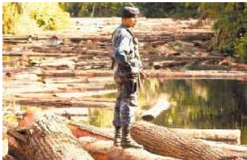
Tucas en el Río Kum Kum-RAAS.

A pesar de la vigencia de esta ley y de acuerdo con los resultados del monitoreo realizado por Centro Humboldt, a un puesto de control ubicado en la Región Autónoma del Atlántico Norte (RAAN), evidencia la insuficiencia de la misma, puesto que se ha identificado que ha habido un aumento del 210% del volumen de madera transportada a través del municipio de Siuna, entre los periodos sin veda (2005) y durante la veda forestal (2007-2009), evidenciando los