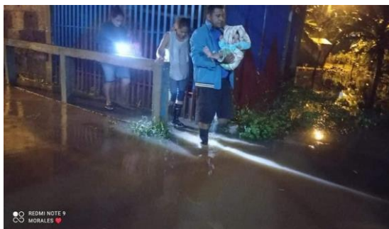
Auto evacuación en El Rama