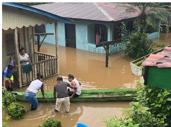
Inundaciones en el municipio El Castillo