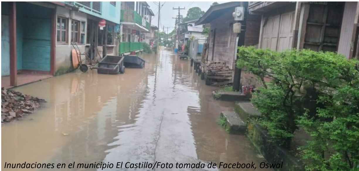
Inundaciones en el municipio El Castillo

Desde nuestra Sala de Situaciones, con el apoyo de la Red de Observación Climática Comunitaria (ROCC), les compartimos nuestro reporte informativo número 8, en el cual hemos compilado datos de precipitaciones registrados en el territorio nacional en las últimas 24 horas y un monitoreo de medios acerca de las afectaciones a los medios de vidas ocurridas en este mismo periodo.