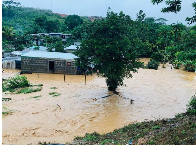
Inundaciones y deslizamientos de tierra en el municipio Santo Domingo/Fuente, Santo Domingo